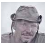
Gil Gautier (Francia), Wildlife photographer www.gilgautier.com