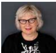
Franka slothouber (The Netherlands), Wildlife photographer www.frankaslothouber.nl